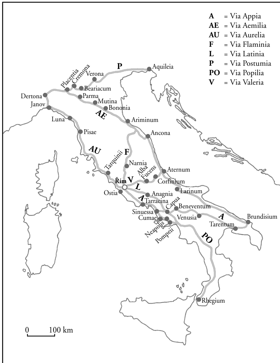
Plánek 1 – Římské dálkové silnice