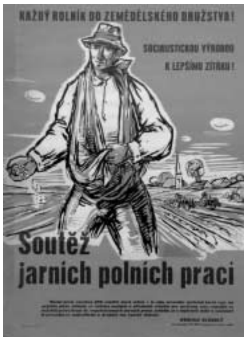
Agitace za socialistické soutěžení – jarní polní práce

úředníků, příslušníků Bezpečnosti, představitelů masových organizací, dělníků, ale i prokurátorů a soudců do politických kampaní za prosazování kolektivizace.