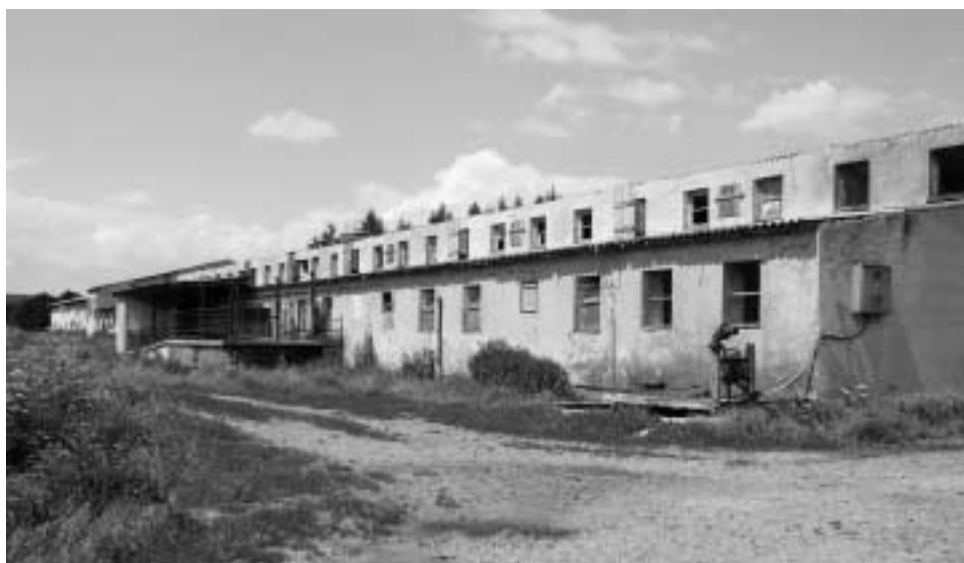
Dnešní stav komplexu bývalého dvora Okrouhlík a opuštěného vepřína za obcí