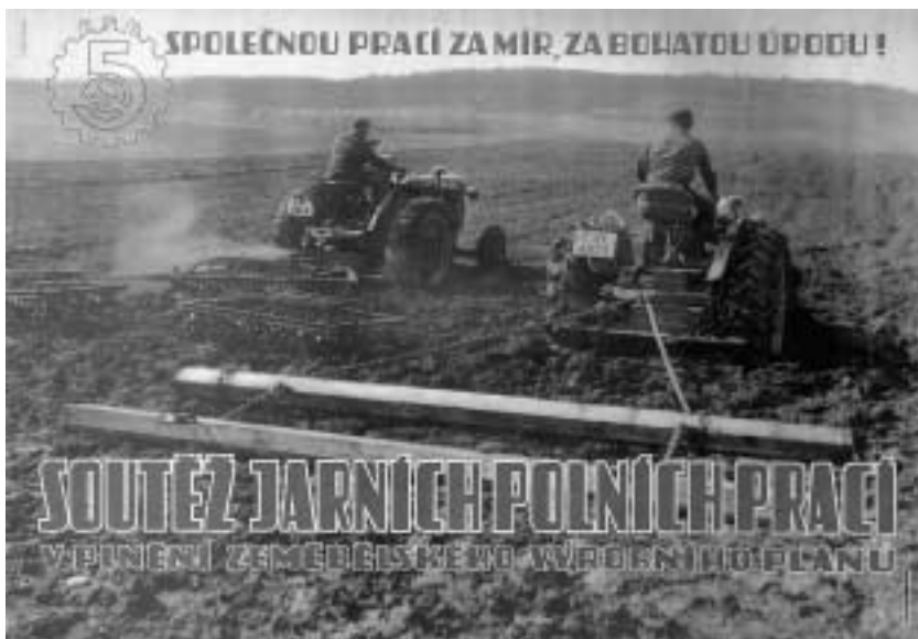
Agitace za socialistické soutěžení – jarní polní práce