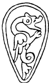
2. Štít na čalouně z Bayeux