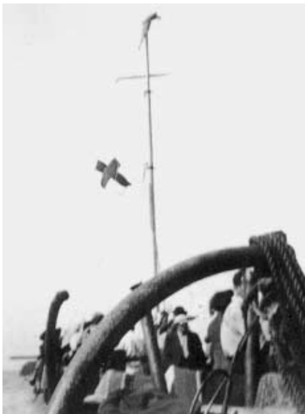
Provizorní plachty z prostěradel, které pasažéři rozvěsili na stožár porouchaného parníčku v Krétském moři. Začátek října 1940.