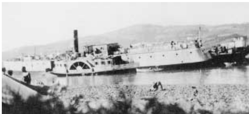
Vystěhovalecký parníček Pentcho kotvící v Bratislavě. 18. květen 1940.