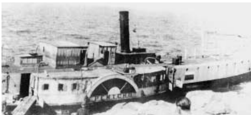
Ztroskotaný Pentcho na útesu ostrůvku Nés Chamili. 8. říjen 1940.