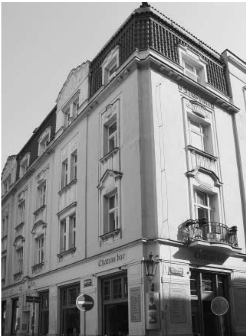
9. Praha, Staré Město: Dům U Štupartů, č. p. 647 – I.