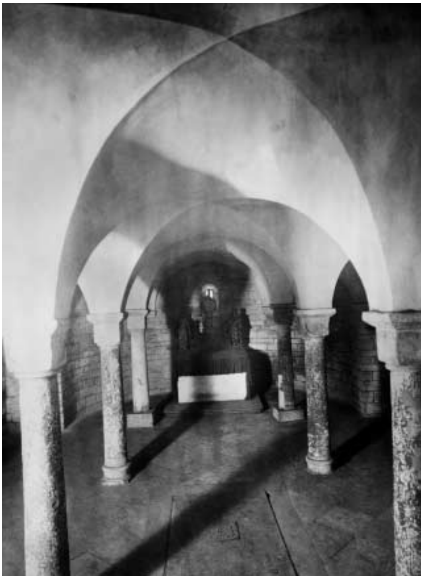
2. Pražský hrad – kostel sv. Jiří: krypta, opatřená v 17. století klenbou, spočívající na třech párech románských sloupů, většinou z 12. stol., s oltářem sv. Mikuláše z 18. stol.