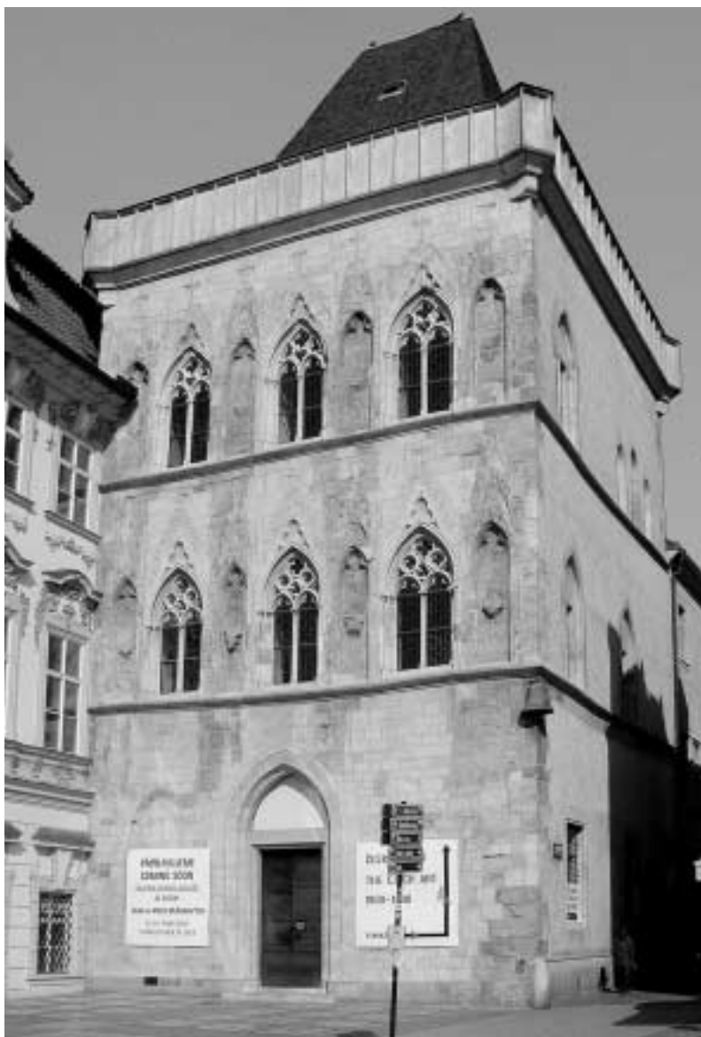
8. Praha, Staroměstské náměstí, dům č. p. 605 - I: U kamenného zvonu, pohled na západní průčelí.