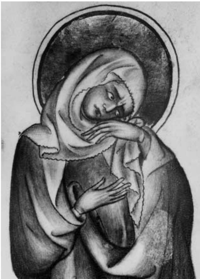
4. Detail iluminace z Pasionálu abatyše Kunhuty: truchličí Marie.