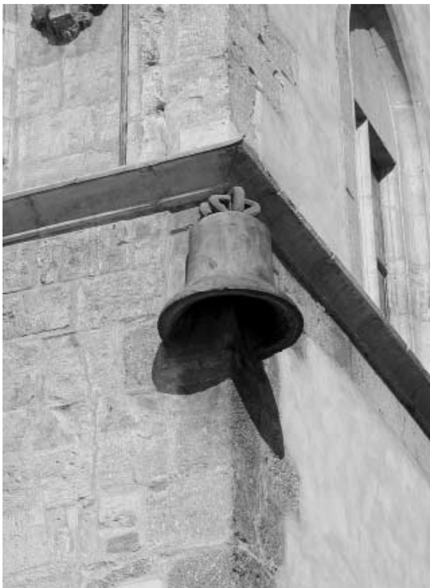
7. Praha, Staroměstské náměstí, dům č. p. 605: U kamenného zvonu, detail s domovním znamením.