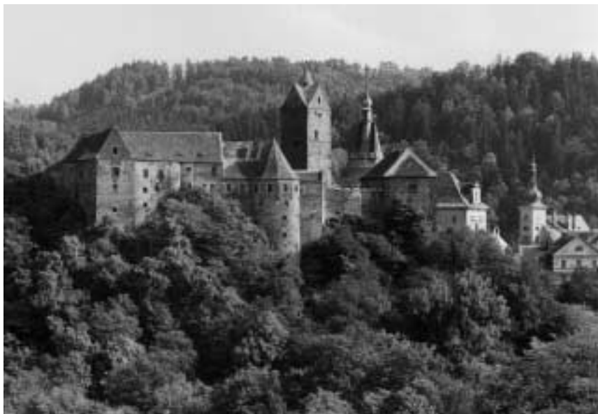
10. Loket, hrad. Pohled od severozápadu.

Královna Eliška, osamocená a izolovaná na hradě Lokti, hledala pomoc u svého manžela, krále Jana. Její poslové, mezi nimiž byl i Petr Žitavský, zastihli krále v Trevíru a vyřídili mu královninu výzvu k rychlému návratu. Odpověděl kladně a 12. listopadu stanul před branami hradu Lokte připraven táhnout s vojskem proti pánovi z Lipé a jeho šlechtickému táboru. Tehdy došlo k události, která by stála v budoucnu za samostatnou úvahou v rámci studia problémů středověkého nacionalismu. Táž šlechta, která z pocitu národního sebevědomí 53 žádá na jaře 1315 českého krále Jana o propuštění cizinců od královského dvora, se v prosinci 1317 s cizinci proti králi spojuje. V čele s Jindřichem z Lipé uzavírá 27. prosince spikleneckou smlouvu s římským vzdorokrálem Fridrichem Sličným Habsburským 54 proti českému králi Janu Lucemburskému. 55 Část české šlechtické obce se spolčuje s příslušníkem rodu, který její mluvčí, neznámý autor Dalimilovy kroniky, pokládá jednou provždy a neodvolatelně za „vrahy Čechů“. 56 Zdá se tudíž, že zdůrazňování vznešeného národního hlediska ze strany české šlechty v roce 1315 je třeba chápat spíše jako pragmatické využití vhodného prostředku v mocenském zápasu s králem.