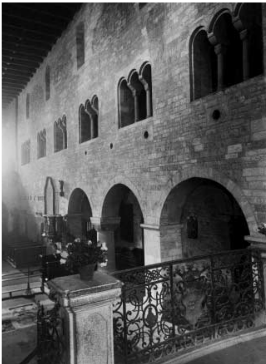
3. Pražský hrad – kostel sv. Jiří: severní stěna hlavní lodi.