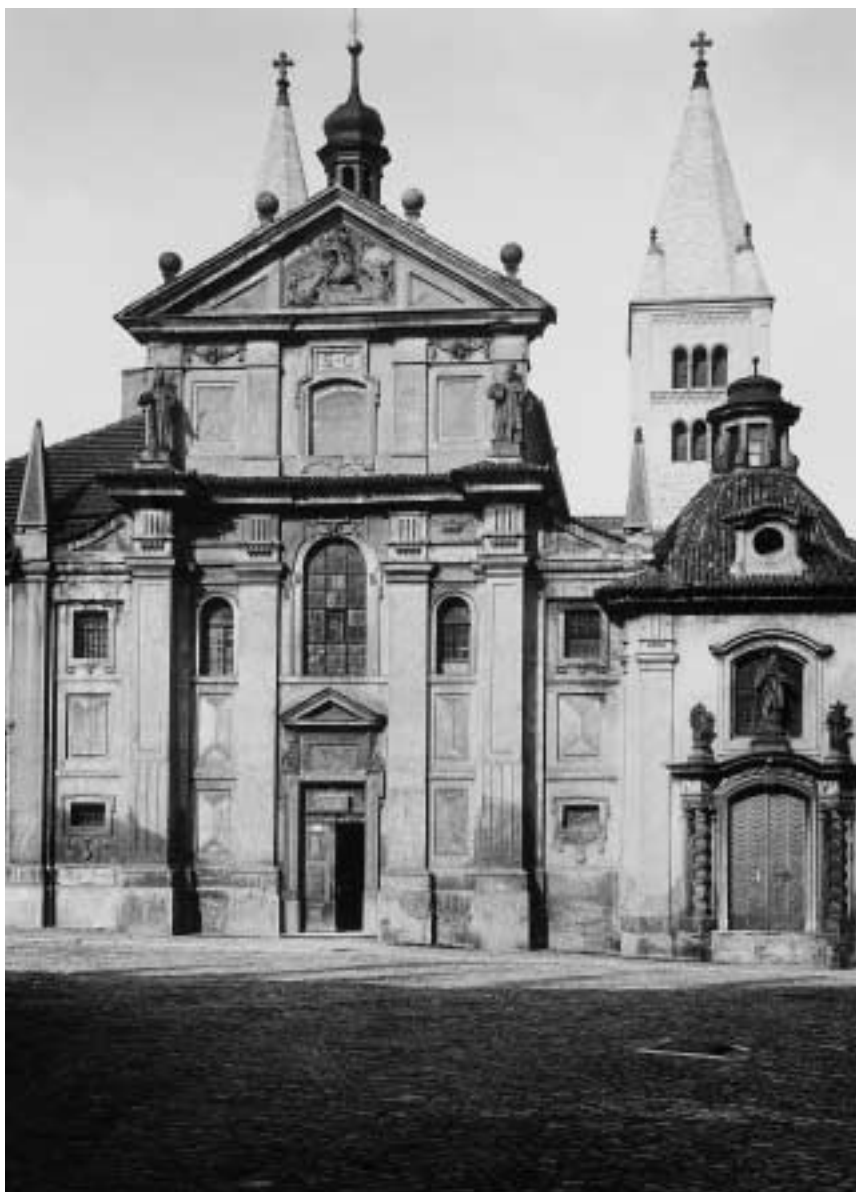
1. Pražský hrad – raně barokní průčelí kostela sv. Jiří (3. čtvrtina 17. století).