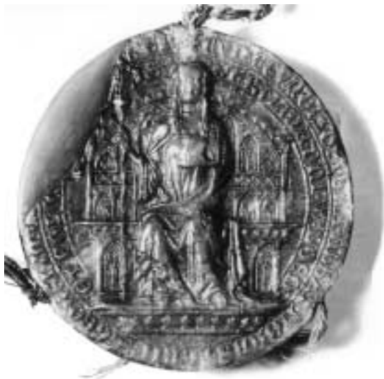
5. Pečeť abatyše Kunhuty Přemyslovny, listina z 19. listopadu 1321.

spolupráci lektora Koldy se svatojiřskou abatyší, Přemyslovnou Kunhoutou. Odtud se odvíjela přízeň, kterou Eliška později už jako královna prokazovala ženské větvi dominikánského řádu. První založení kláštera na místě zvaném Královská zahrada za brněnskými hradbami v roce 1312, k němuž král přikročil z jejího podnětu, bylo určeno právě dominikánkám. 50 Za důkaz její přízně může posloužit také vstřícnost ke klášteru dominikánek u sv. Vavřince, který byl pod duchovní správou Koldova svatoklimentského kláštera. Zvlášť výmluvná jsou slova listiny z 11. září 1330, jimiž Eliška kriticky i sebekriticky přiznává, že se znovuzaložením kláštera dominikánek na Újezdu snažila vyjít vstříc „nevhodnému naléhání některých dominikánů“. 51