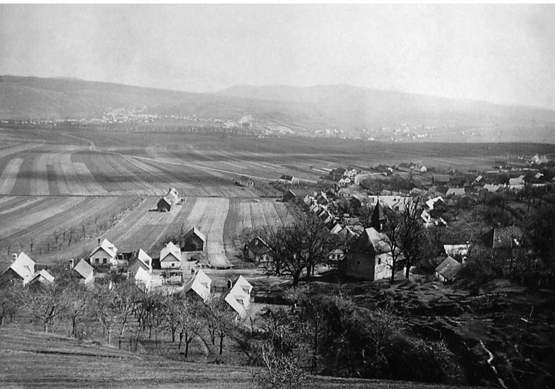
Dúbravka ve 30. letech 20. století. Tento snímek, stejně jako i některé další, pořídil její nejslavnější rodák Gustáv Husák.