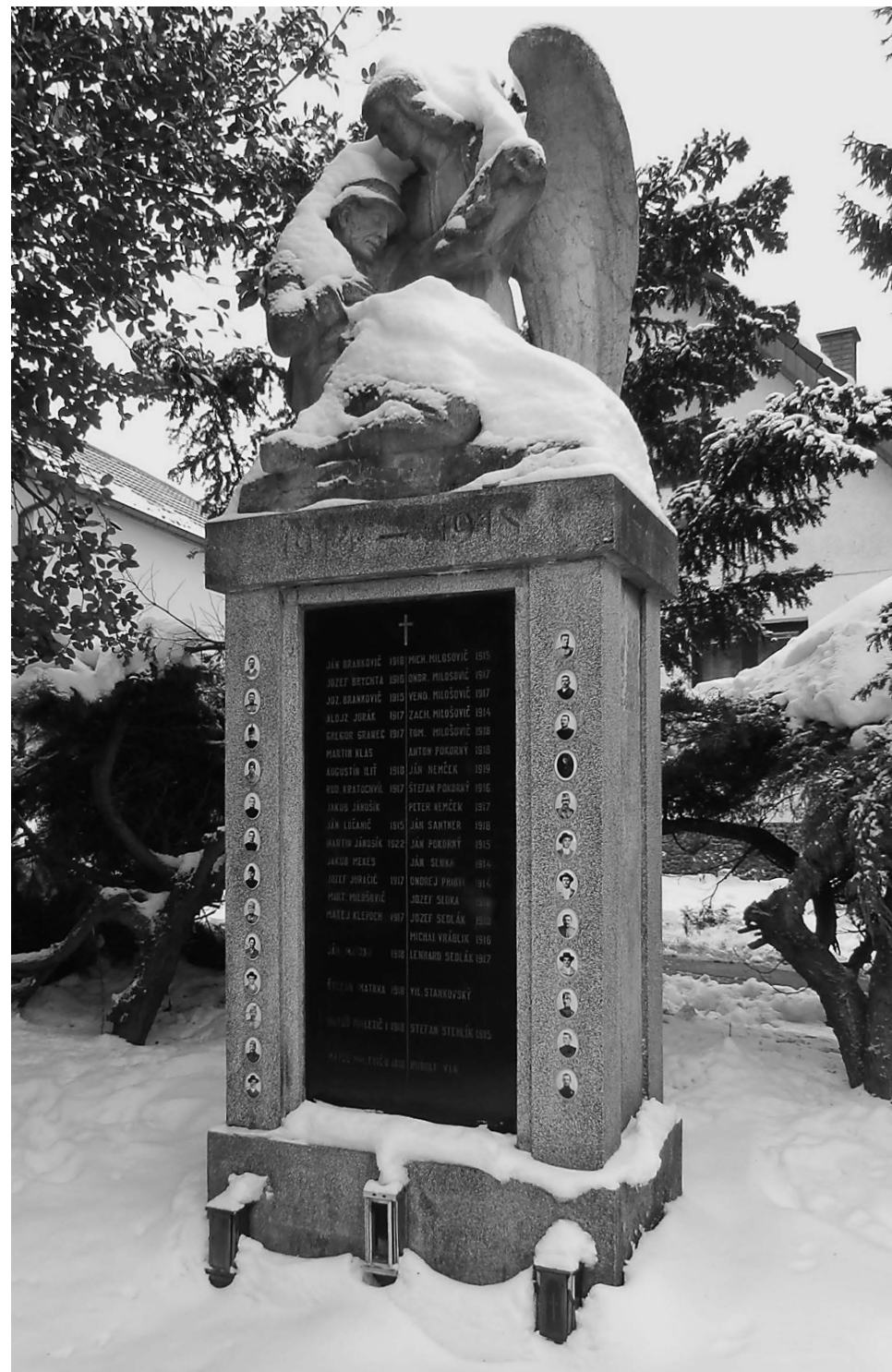
Pomník obětem první světové války v Dúbravce.