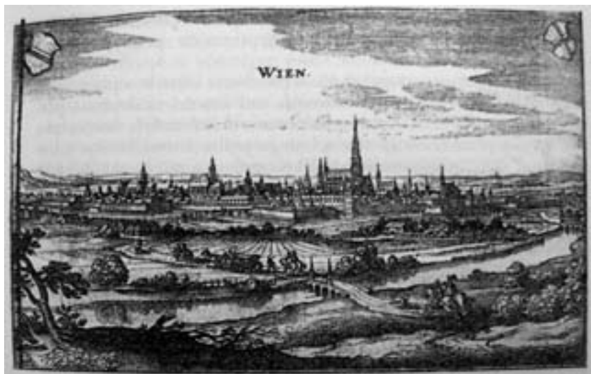
Vídeň na rytině z první poloviny 17. století

z Boskovic a na Třebové jako student na univerzitě ve Vídni. 38 Konec konců nejen Albrecht měl se studiem na této instituci své zkušenosti, v minulosti se zde alespoň po nějakou dobu vzdělávalo dalších šest členů boskovického rodu, mezi jinými například i jmenovaný olomoucký biskup Tas z Boskovic. Kromě praktické skutečnosti, že se město na Dunaji nacházelo poměrně blízko boskovickým državám na Moravě, poskytoval Šemberovi pobyt ve Vídni mnoho dalších možností. V centru se nepoměrně snáze navazovaly kontakty s dalšími mladými šlechtici, ale lákavá byla především příležitost dostat se k císařskému dvoru. 39