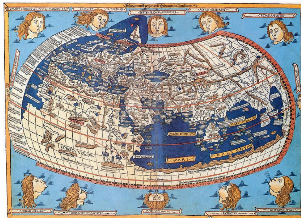
Mapa Claudia Ptolemaia zaznamenala celou tehdy známou ekumenu, tj. obydlený svět. Reprodukce z 15. století.