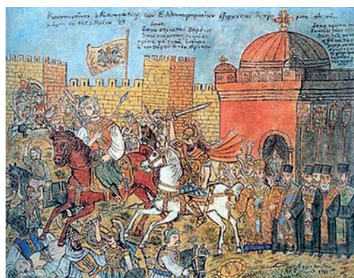
Pád Konstantinopole (Cařihradu) v roce 1454, jak jej zobrazil Theophilus Hatzimihail na počátku 20. století.

V naší knize se zaměříme především na to, jak přispěli příslušníci jednotlivých evropských národů k největším zeměpisným objevům a nejobdivuhodnějším cestovatelským výkonům.